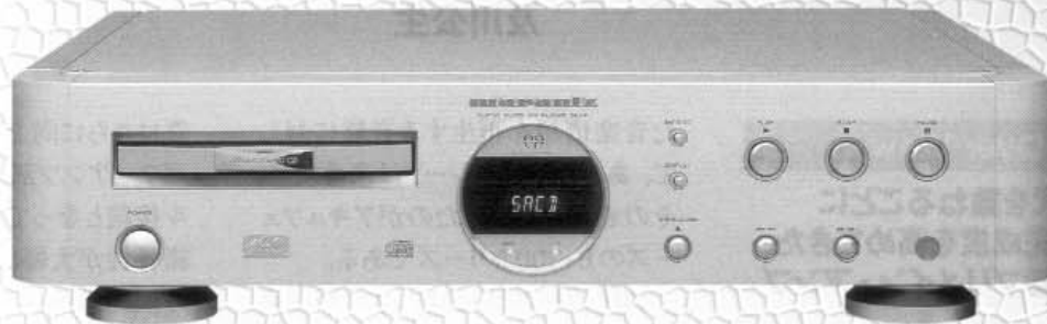
SACDプレイヤー：マランツ SA-14 ver.2 ¥283,500(税込み)

【主要規格】 D/Aコンバーター：SACD DAC（シーラスロジック社製CS4397）ディファレンシャル搭載、再生周波数範囲：2Hz～100kHz（スーパーオーディオCD再生時）、周波数特性：2Hz～50kHz -3dB（スーパーオーディオCD再生時）、2Hz～20kHz（CD再生時）、高調波歪率：0.0015%、ダイナミックレンジ：113dB（スーパーオーディオCD再生時）、外形寸法：458×110×392(WHD)mm、質量：11.8kg