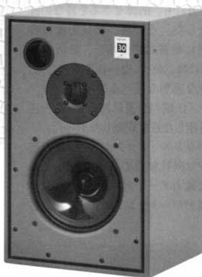
スピーカー： ハーベス