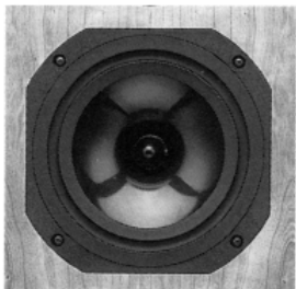
ウーファーには、ポリプロピレン素材に特殊コーティングを施した、20cm口径のRADIALコーンが採用される。

英国のスピーカーは、いくつもの流派に分けることができるが、BBCモニターに端を発するいわば中道派の最右翼がハーベスだ。堅実でオーソドックスなのに、時おり驚くほど大胆な裏技を繰り出す。 スーパーHL5は、1988年に登場したヒット作HL5のリニューアルモデルで、アウトラインはHL5にチタンコーティング・ドームのスーパートウィーターを加えて広帯域化を図った3ウェイシステムとなる。クラシカルな形状のバスレフ型エンクロージャーは複数素材を重ね合せた特殊な台板構造で、打てば響くように薄く、内部には適所に補強が入っている。フロントとリアのパツフルはネジ止め。スーパー・チューンド・ストラクチャーと呼ばれる楽器風の作りは、ハーベスのお家芸である。 構造的に左右チャンネルの区別はないのだが、ラベルにはマッチド・シリアルナンバーが貼付されている。入力端子は、ストラッピンング